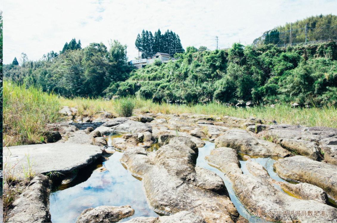
※ 川内川河川敷足湯