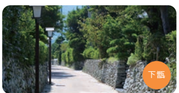
手打麗武家屋敷通り

レンタカー情報 当社にてレンタカーのお手配も可能です。配車店舗のみの返車となります。(乗り捨て不可)