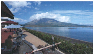
⑤ 道の駅たるみず「湯っ足り館」