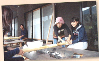
バームクーヘン作り