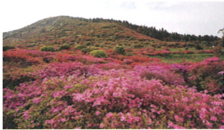
③ 高峠つつじヶ丘公園