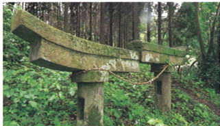
⑥ 牛根麓埋没鳥居展望公園