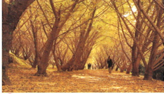
② 垂水千本イチョウ