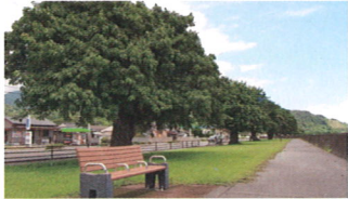
④ アコウ並木・宮脇公園