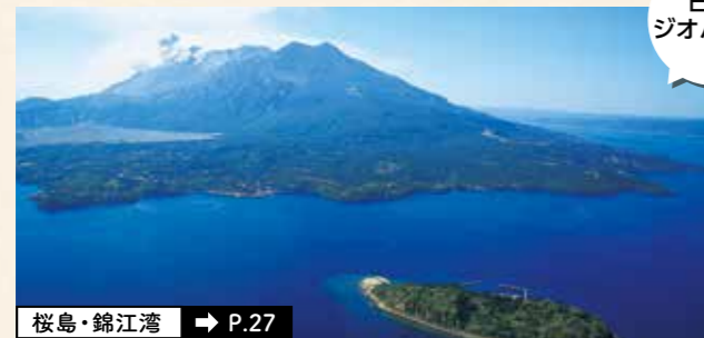
桜島・錦江湾 → P.27