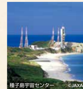
種子島宇宙センター