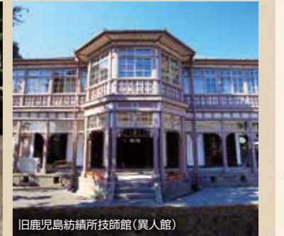
旧鹿児島紡績所技師館(異人館)