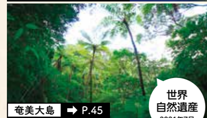
奄美大島 → P.45