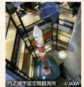
内之浦宇宙空間観測所