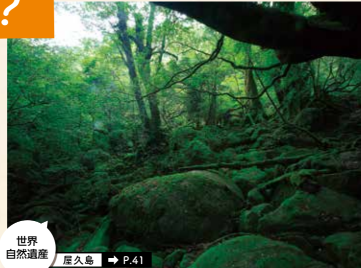
世界自然遺産 屋久島 → P.41

鹿児島は日本の南西部に位置し、屋久島をはじめ多くの離島が連なった南北に長い県です。温暖な気候と個性ある歴史・文化、豊かな食に加え、県内各地に温泉地が点在し、年間を通して県外から多くの観光客が訪れています。また、鹿児島のシンボルである桜島・錦江湾は日本ジオパークに認定されていて、様々な体験と共に火山と人と自然のつながりを学ぶことができます。