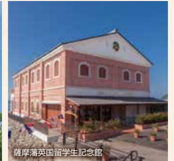
薩摩藩英国留学生記念館