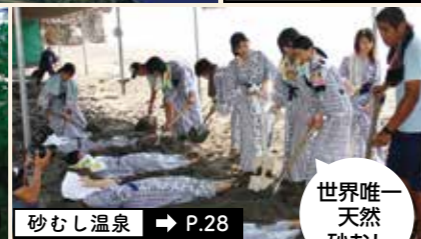
砂むし温泉 → P.28