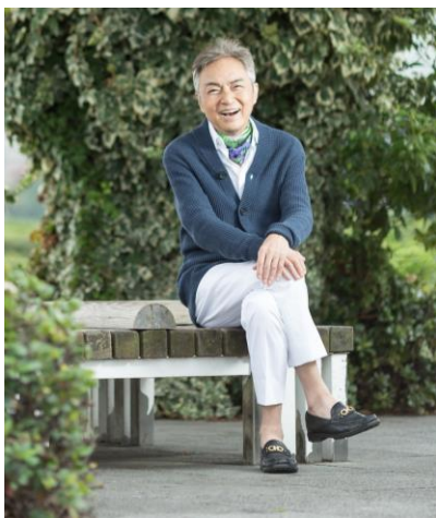
応援サポーター 西郷 輝彦さん 歌手・俳優

星は今現在も宇宙で生まれています。生まれた星は核融合反応によって、我々の体を形作っている炭素、酸素、窒素などの元素を作ります。宇宙ができた当初は水素、ヘリウム、リチウムのみが存在しており、炭素、酸素、窒素などの元素は存在しませんでした。つまり、星が誕生することで初めて我々の源が作られたのです。星ができると、その周りに我々の住処である地球のような惑星も形作られます。我々の起源は星なのです。私は、宇宙でどのように星や惑星が形成されているのかを研究しています。宇宙を学ぶことは生命の起源を学ぶことです。