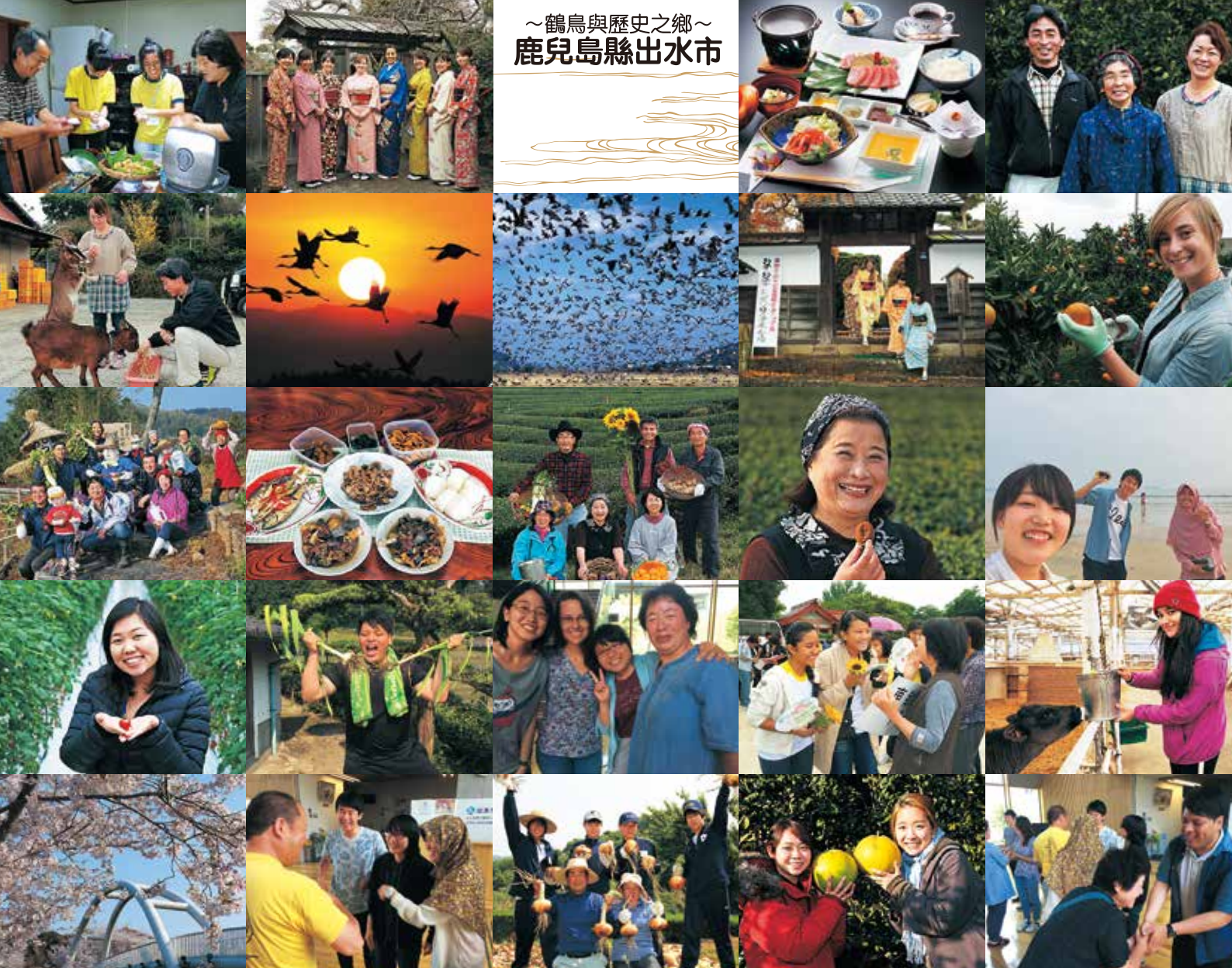
~鶴鳥與歷史之鄉~ 鹿兒島縣出水市