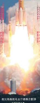
鹿兒島縣熊毛支庁總務企劃課 內見為鹿久島