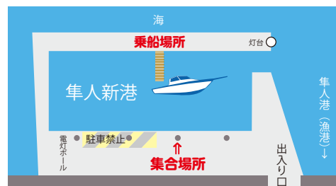
隼人新港内駐車場は駐車禁止場所以外を使用してください。(駐車場無料)