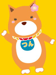
薩摩川内市公認 キャラクター 西郷つん