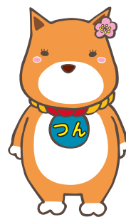
薩摩川内市公認キャラクター 西郷つん

① 9:30～10:30 ②11:00～12:00 ③13:30～14:30 ④15:00～16:00