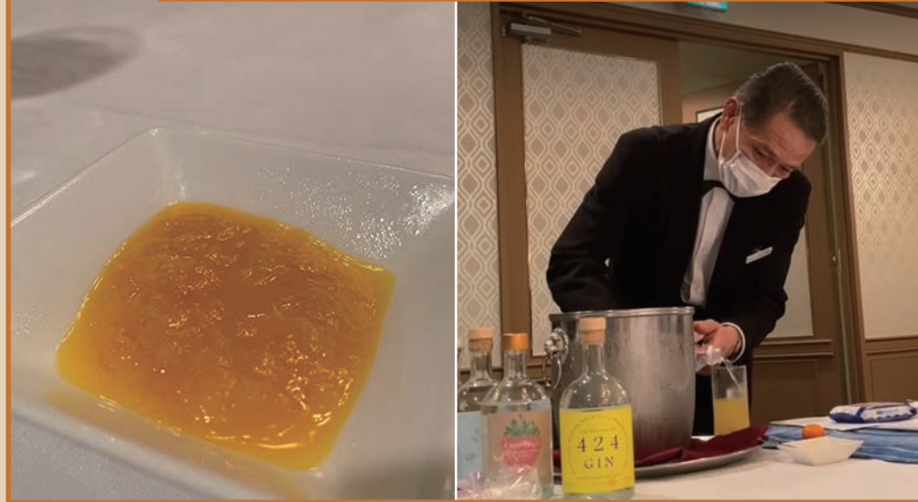
B. 特産 桜島小みかんジャム × 焼酎ブレンド