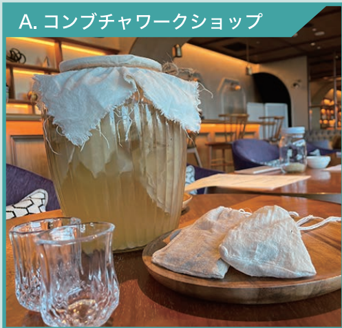
A. コンブチャワークショップ