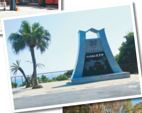
◀北緯31度線 展望広場