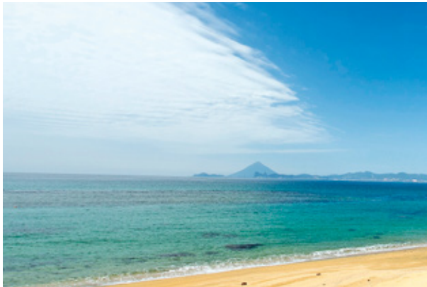
▲ゴールドビーチ大浜