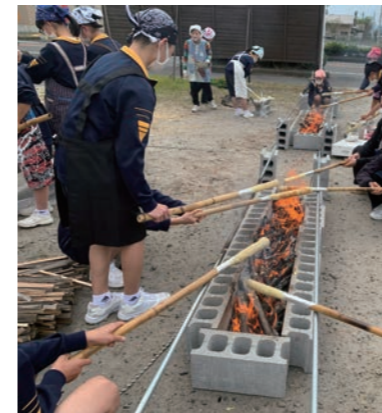
民泊体験 (NPO法人プロジェクトたるみず)

* 個別の体験内容の詳細は、体験プログラム集をご参照ください。 ♡ こちらのマークがあるところでは、ユニバーサル対応も行っていきます。具体的な受入状況については、一度お問い合わせください。