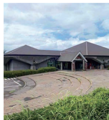
桜島ビジターセンター

* 個別の体験内容の詳細は、体験プログラム集をご参照ください。 こちらのマークがあるところでは、ユニバーサル対応も行っています。具体的な受入状況については、一度お問い合わせください。