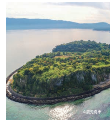
新島ガイドプログラム（ふるさと再生プロジェクトの会）