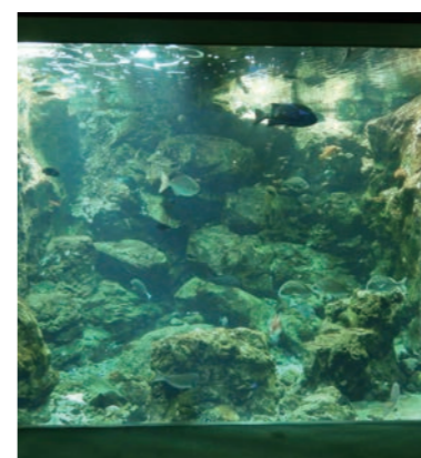
錦江湾水槽（いおワールドかごしま水族館）