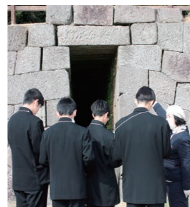
園内ガイドツアー（仙巖園）

* 個別の体験内容の詳細は、体験プログラム集をご参照ください。 ♡ こちらのマークがあるところでは、ユニバーサル対応も行っていきます。 具体的な受入状況については、一度お問い合わせください。