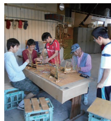
民泊体験（NPO法人プロジェクトたるみず）