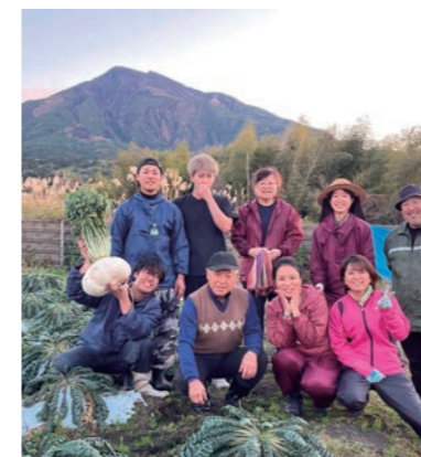
農業体験（ファームランド櫻島）