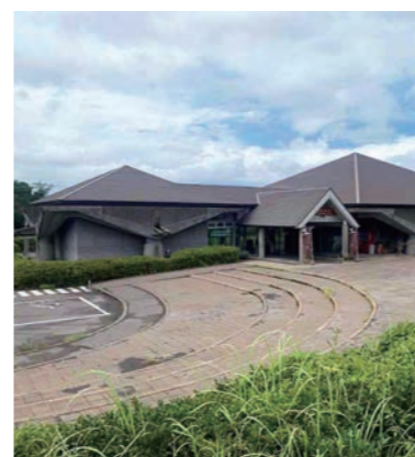
桜島ビジターセンター

* 個別の体験内容の詳細は、体験プログラム集をご参照ください。 こちらのマークがあるところでは、ユニバーサル対応も行っています。具体的な受入状況については、一度お問い合わせください。