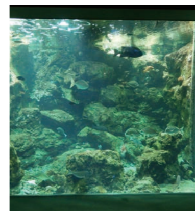
錦江湾水槽（いおワールドかごしま水族館）