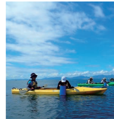
海から桜島を楽しむ3時間ツアー（かごしまカヤックス）

* 個別の体験内容の詳細は、体験プログラム集をご参照ください。 ♡ こちらのマークがあるところでは、ユニバーサル対応も行っていきます。具体的な受入状況については、一度お問い合わせください。