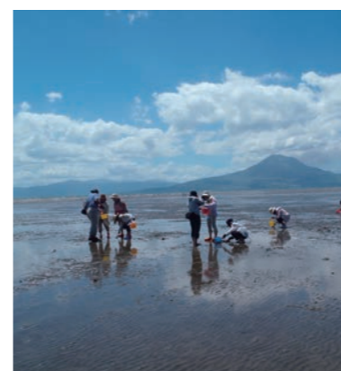
錦江湾の生き物観察ツアー（重富海岸自然ふれあい館なぎさミュージアム）