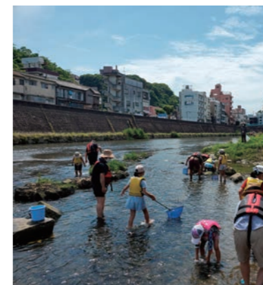
川の自然観察～河川調査隊（重富海岸自然ふれあい館なぎさミュージアム）

おことわり プログラム内容例に記載された3泊4日の日程、訪問先、体験場所、所要時間等については、教育旅行の実施時期、訪問先様の諸事情、交通事情等により変更が生じる場合がございます。あらかじめご了承ください。