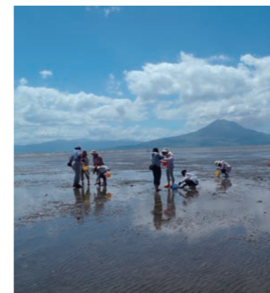
錦江湾の生き物観察ツアー（重富海岸自然ふれあい館なぎさミュージアム）

* 個別の体験内容の詳細は、体験プログラム集をご参照ください。 ♡ こちらのマークがあるところでは、ユニバーサル対応も行っていきます。具体的な受入状況については、一度お問い合わせください。