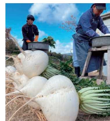
農業体験（ファームランド桜島）