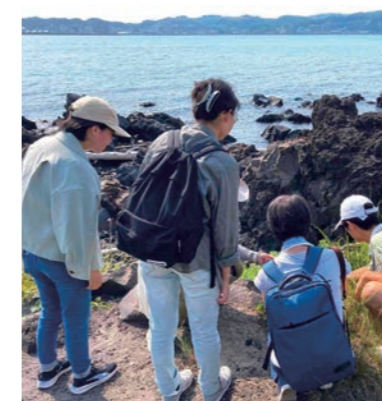
★UDさくらじま★溶岩体感ガイドコース（桜島ジオサルク）