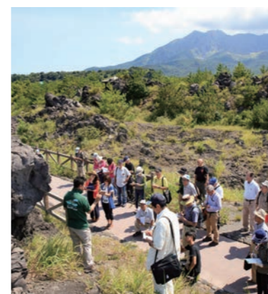
桜島火山体験ツアー（桜島ミュージアム）