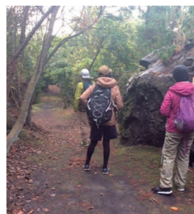
SABOトレッキング（桜島ジオサルク）