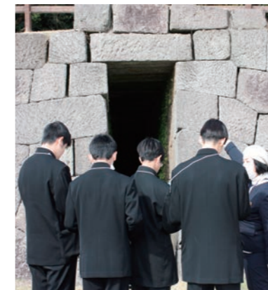
園内ガイドツアー (仙巖園)