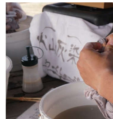
火山灰染め体験（温順人島桜島工房）