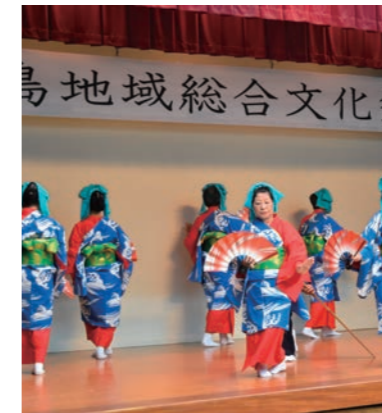
小池島廻り踊りについて講話 (小池島廻り踊り保存会)