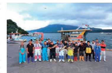
垂水市漁業協同組合の皆さん

垂水市漁業協同組合は養殖業者と共に安全・安心でおいしい魚を提供できるように、漁場に与える環境負荷を軽減する持続的養殖、環境保全のための循環型養殖等、様々な取り組みを続けています。桜島の麓の錦江湾という素晴らしい環境のもとで、カンパチの餌やり体験や加工体験・試食などを通して養殖業の素晴らしさを肌で感じていただければと思います。また、漁協直営の「味処 海の桜島」では新鮮な海鮮を使った料理を堪能していただけます。