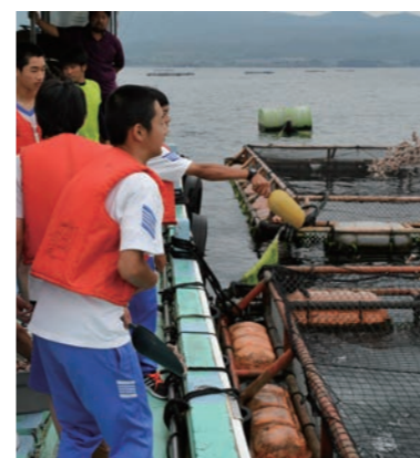
漁業体験（垂水市漁業協同組合）

* 個別の体験内容の詳細は、体験プログラム集をご参照ください。 こちらのマークがあるところでは、ユニバーサル対応も行っていきます。具体的な受入状況については、一度お問い合わせください。