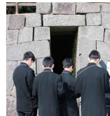
仙巖園・園内ガイドツアー