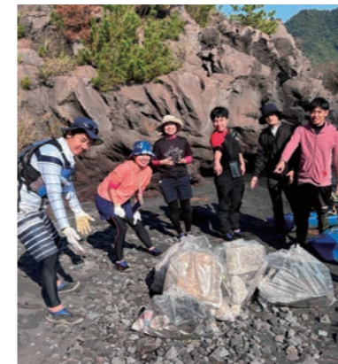
シーカヤックdeビーチクリーン（かごしまカヤックス）

* 個別の体験内容の詳細は、体験プログラム集をご参照ください。 ♡ こちらのマークがあるところでは、ユニバーサル対応も行っていきます。具体的な受入状況については、一度お問い合わせください。