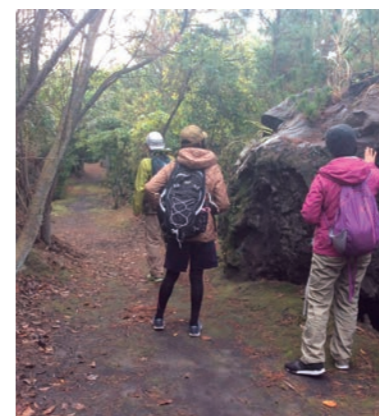
SABOトレッキング（桜島ジオサルク）