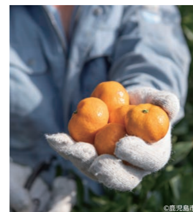
果物狩り体験（吉原果樹園）