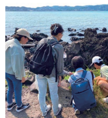
溶岩体感コース（桜島ジオサルク）