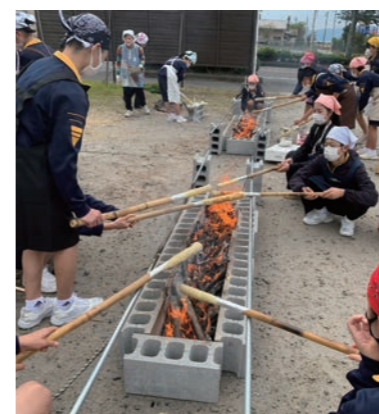
民泊体験（NPO法人プロジェクトたるみず）