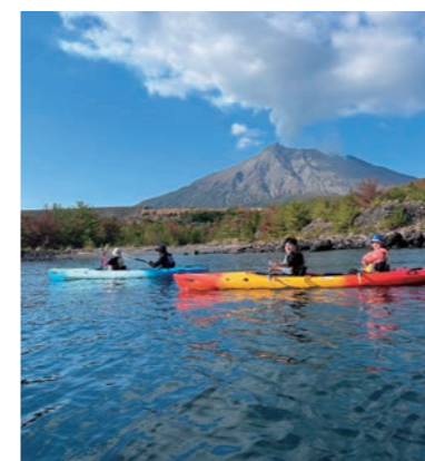
島歩き&プチャカヤック体験（かごしまカヤックス）