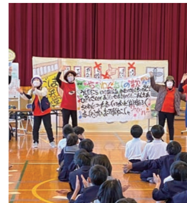
鹿児島弁劇体験 (鹿児島県方言文化協会)