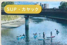
甲突川でアクティビティ体験!

定期開催時は、右岸エリアにて遊覧船やアクティビティの受付をします。お花見シーズンや他イベントとのコラボ時には高麗橋近くの緑地にてキッチンカーやマルシェも出店します!詳細は公式サイト・Instagramにて!