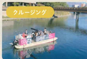
甲突川をのんびり遊覧♪