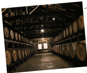
石蔵樽貯蔵庫で ウイスキーを熟成