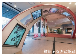
維新ふるさと館蔵